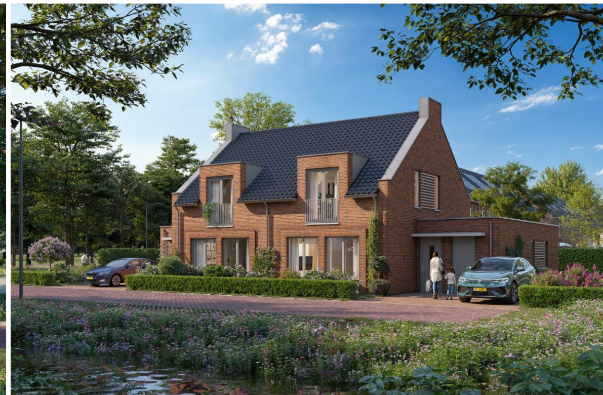
6x levensloopbestendige tweekapper